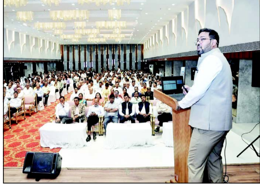
ઈન્કમ ટેક્સ એક્ટ-૨૦૨૫ અંગે ઈન્કમ ટેક્સ વિભાગ દ્વારા આઉટ રીચ કાર્યક્રમ પરમર્શ-૨૦૨૫નું આયોજન સુરતના સીટીલાઈટ ખાતે આવેલા દ્વારકા હોલમાં કરવામાં આવ્યું હતું. આ કાર્યક્રમમાં ઈન્કમ ટેક્સ વિભાગના ઉચ્ચ અધિકારીઓ દ્વારા માર્ગદર્શન આપવામાં આવ્યું હતું.

પ્રતાપ પ્રતિનિધિ, સુરત, તા. ૨૧ ભટાર-ઉદના મગદલા રોડ પર વહેલી સવારે દુકાનમાં આગ આર્ટ ગેલેરી અને હોમ ડેકોર શોરૂમમાં આગ લાગતા દોડધામ મચી ગઈ હોવાનું જાણવા મળે છે. સુરતના ન્યૂ ભટાર વિસ્તારમાં ઉદના-મગદલા રોડ પર આવેલી બ્લેક રોક બિલ્ડિંગમાં વહેલી સવારે આગ લાગતા અફરાતફરી મચી ગઈ હતી. આગ “બાલાજી” નામની દુકાનમાં લાગી હોવાનું