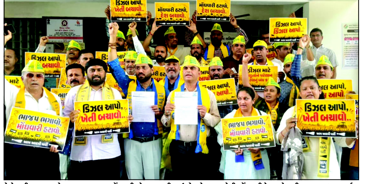
વેટોલ-ડીઝલ તથા ગેસના ભાવ વધતા મોંઘવારી બેઠાકાળ બની ગઈ છે. બેઠામ બનેલી મોંઘવારીને પગલે ગરીબ તથા મધ્યમ વર્ગના લોકોએ પણ ભારે મુશ્કેલી વેઠવી પડે છે. મોંઘવારીમાં પીસાતી જનતાને રાહત આપવાની માંગણી સાથે સુરત આમ આદમી પાર્ટી દ્વારા સુરત જિલ્લા કલેક્ટર કચેરીએ વિરોધ પ્રદર્શન યોજવામાં આવ્યું હતું.