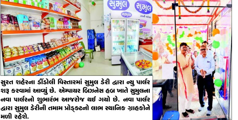
સુરત શહેરના ડીંગોલી વિસ્તારમાં સુમલ હેરી દ્વારા ન્યુ પાર્લર શરૂ કરવામાં આવ્યું છે. એમ્બાયર બિઝનેસ કેન્ટ્રલ ડેવલપમેન્ટ નવા પાર્લરનો શુભારંભ આજરોજ થઈ ગયો છે. નવા પાર્લર દ્વારા સુમલ ડેરીની તમામ પ્રોડક્ટનો લાભ સ્થાનિક ગ્રાહકોને મળી રહેશે.